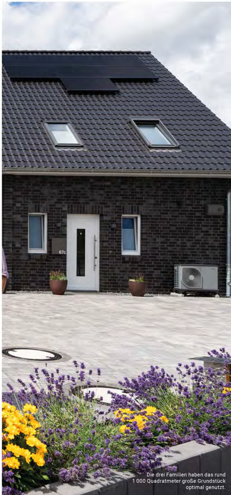
Die drei Familien haben das rund 1 000 Quadratmeter große Grundstück optimal genutzt.

Drei Familien bauten hier gemeinsam: drei Häuser in Reihe, die den individuellen Ansprüchen der Bewohner gerecht werden und ein zukunftsfähiges Energiekonzept haben.