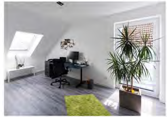
Ein Zimmer im Obergeschoss wird als Arbeitsraum genutzt.