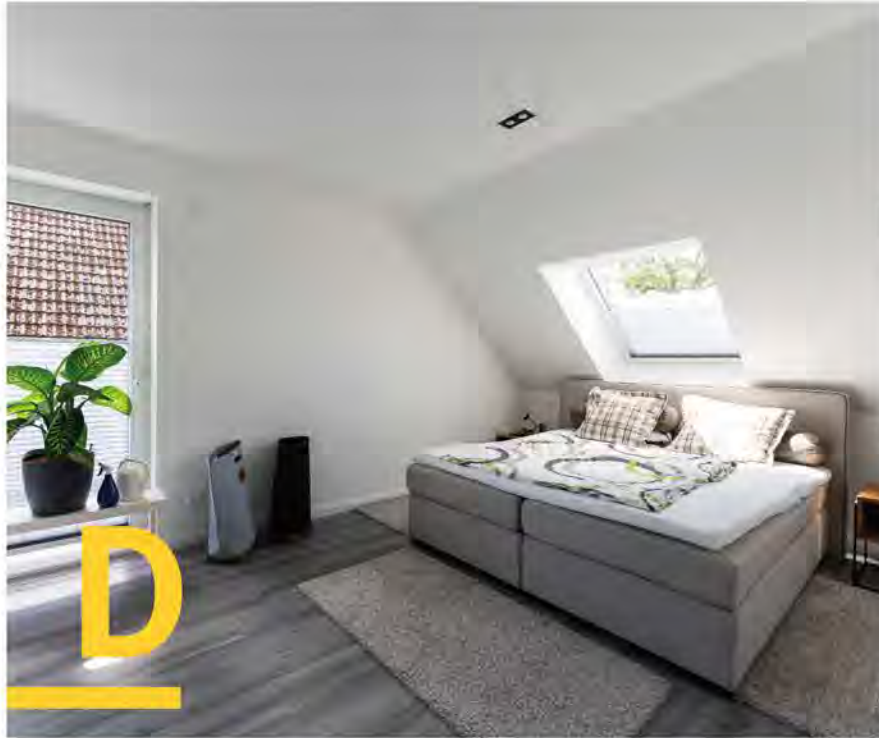
Vom Bett aus zu den Sternen schauen: Das entsprechend platzierte Dachfenster macht's möglich.